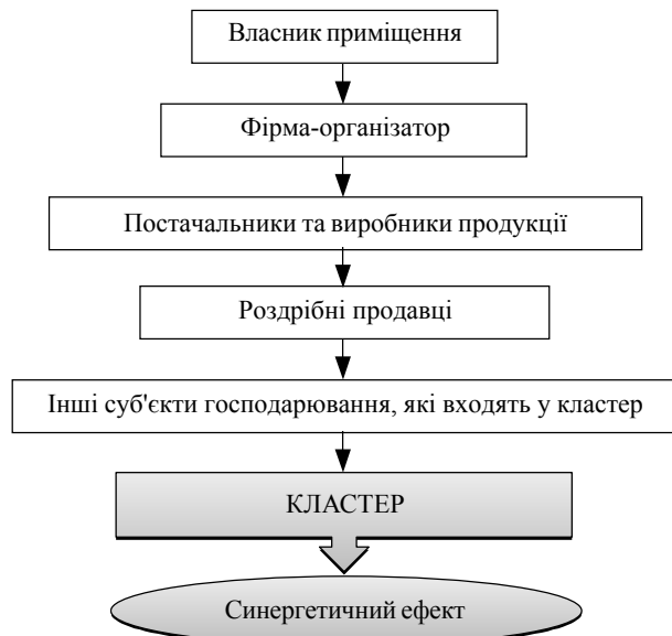
Рис. 2. Процес кластеризації

кожного підприємства, яке діє в визначеній групі підприємств (рис. 2). Оптимізація внаслідок взаємодії всіх видів діяльності на підвалинах синергетичного ефекту носить стратегічний характер, бо надає переваги в порівнянні з іншими суб'єктами господарювання.