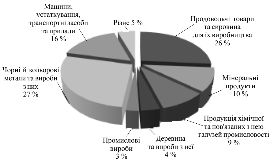
Рис. 3. Товарна структура експорту України